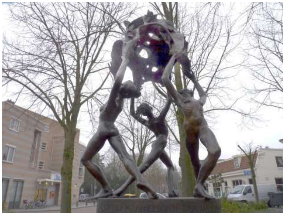
Onderdak (1987) Locatie Rosmalen, Dorpsstraat